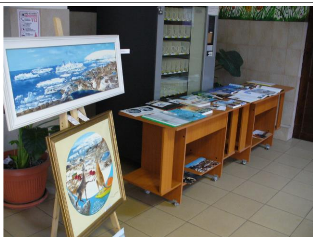
Exponate documentar - științifice și artistice: Expediția Belgica și cooperarea României cu Australia în Antarctica